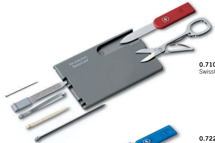
0.7106 SwissCard Classic