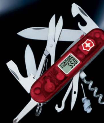
1.7905.AVT Traveller Lite con las 23 funciones del Voyager Lite, más: 24. tiempo de marcha 25. Altímetro m / pies 26. barómetro 27. termómetro °C/°F

Voyager Lite y Traveller Lite también disponibles en color ónix