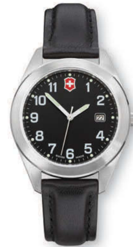
26035.CB GARRISON Ø 34 mm