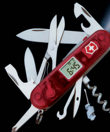
1.7905.VT Voyager Lite con las 12 funciones estándar, más: 13. tijeras 14. gancho universal multiuso con 15. - lima para uñas 16. bolígrafo 17. alfiler (de acero inoxidable) 18. mini-destornillador 19. reloj digital con 20. - despertador 21. - minutero 22. destornillador «Phillips» 23. LED de luz blanca

Colores disponibles para Spartan Lite y Huntsman Lite ver página 7