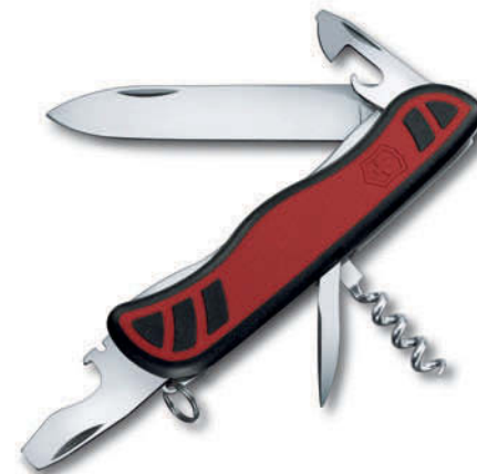
0.8351.C Nomad rojo / negro 0.8353.3 Nomad negro