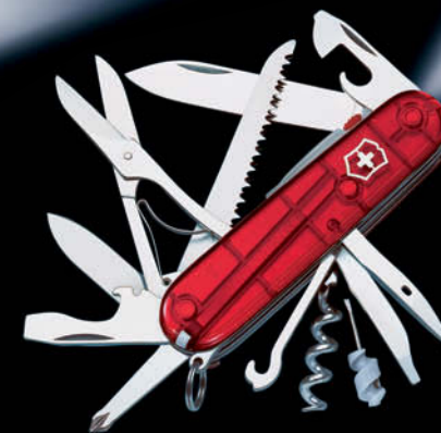
1.7915.T Huntsman Lite

Colores disponibles para Spartan Lite y Huntsman Lite ver página 7