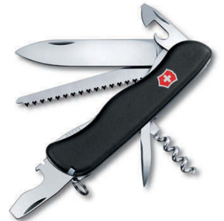
0.8363.3 Forester negro 0.8361.C Forester rojo / negro