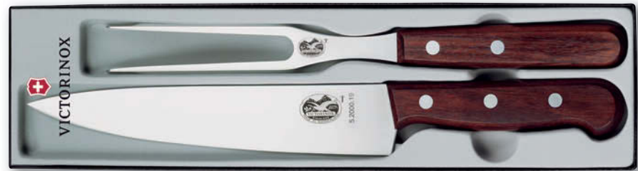
5.1020.2 juego de 2 piezas para trinchar mangos de madera