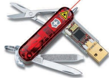
Victorinox Flash Laser 4.6027.TG (...) ...capacidad de memoria a elegir