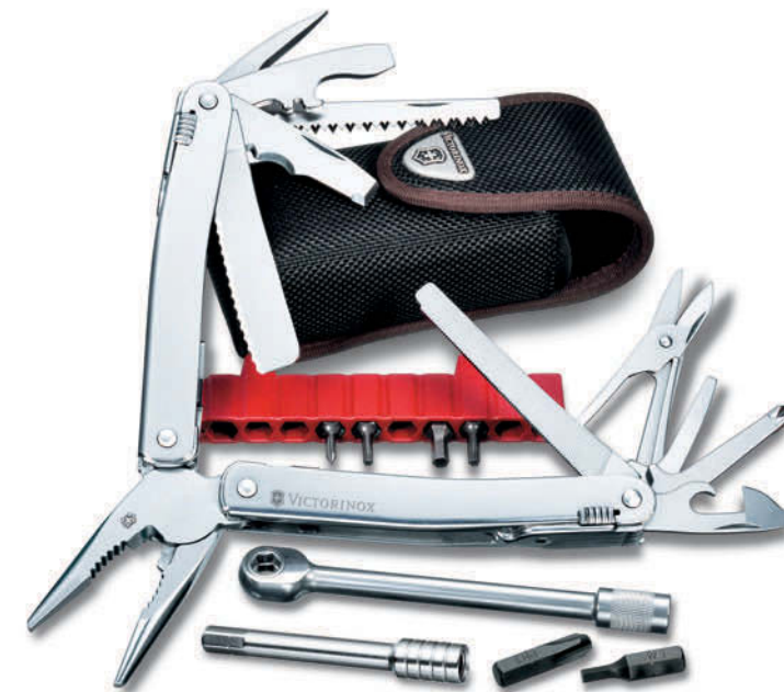
SwissTool Spirit Plus 3.0239.N