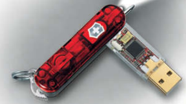
Victorinox Flash Flight 4.6076.TG (...) ...capacidad de memoria a elegir