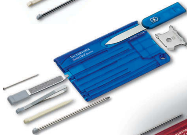
0.7222.T2 SwissCard Quattro