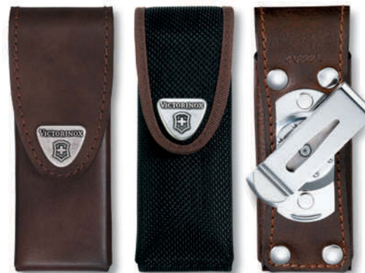
estuche de piel .L de nylon .N de piel .L1