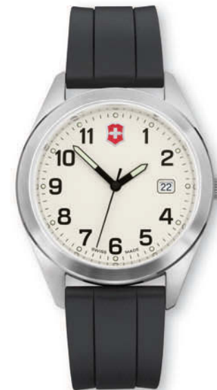
26024.CB GARRISON Ø 40 mm