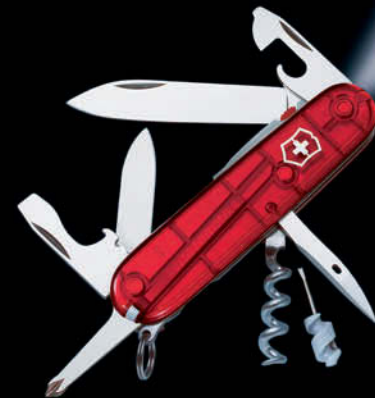
1.7804.T Spartan Lite