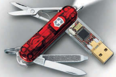
Victorinox Flash 4.6026.TG (...) ...capacidad de memoria a elegir