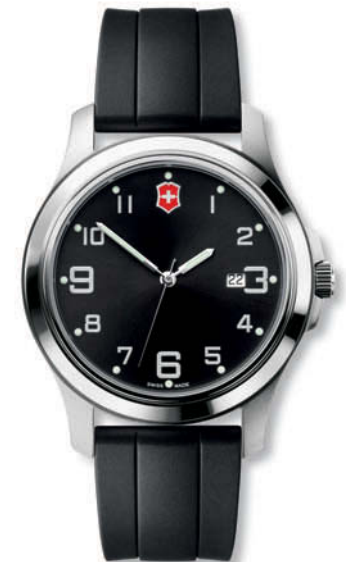
26055.CB GARRISON ELEGANCE Ø 40 mm