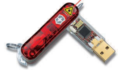
Victorinox Flash Flight Laser 4.6077.TG (...) ...capacidad de memoria a elegir