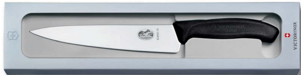
6.8003.19G SwissClassic cuchillo para trinchar