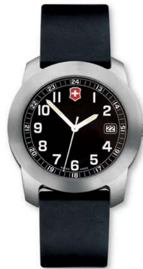
26008.CB FIELD Ø 38,5 mm