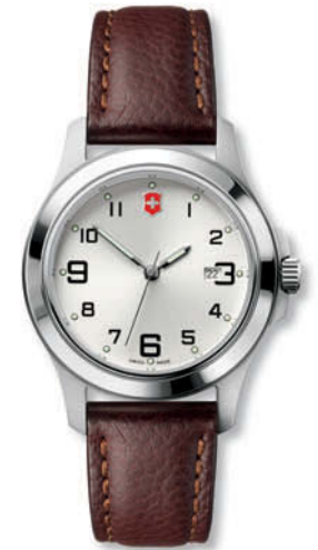
26058.CB GARRISON ELEGANCE Ø 32 mm