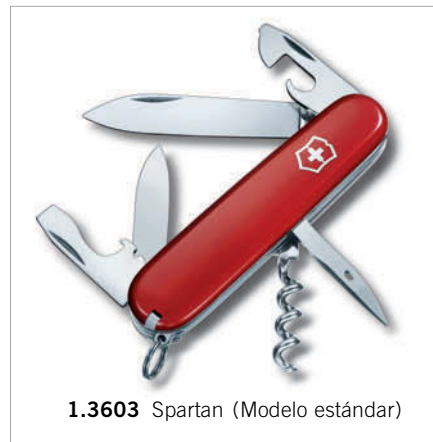
1.3603 Spartan (Modelo estándar)