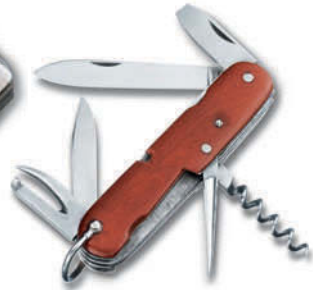
Navaja del Oficial Suizo 1897