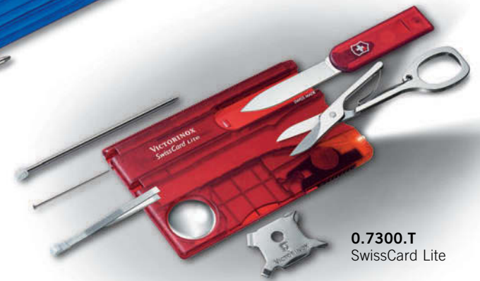
0.7300.T SwissCard Lite