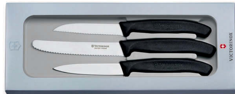
6.7113.3G SwissClassic juego de 3 piezas para verdura