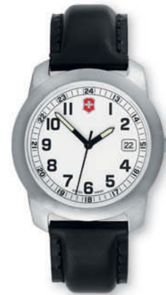
26003.CB FIELD Ø 30 mm