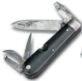
Navaja del Soldado Suizo 1891